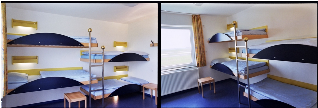
Beispielzimmer Deichhaus Standard mit festem Stockbetten