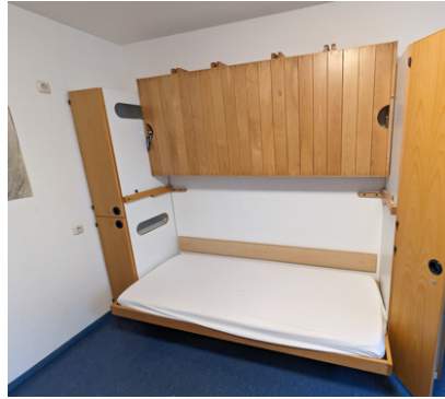
mit hochklappbaren Stockbett